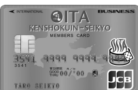
※イメージ写真です

JCBカードと提携した組合員証を発行しています。JCBゴールドカードの基本機能が付いており、作成費も年会費も無料(通常年会費は11,000円)です。利用メリットも満載、ETCスルーカード、クイックペイカードも取得できます。組合員証を使ってトキハグループで買物をすると請求時2%が割引されて大変お得。毎年4月からの1年間、空港ラウンジを年間6回まで無料で利用できます。