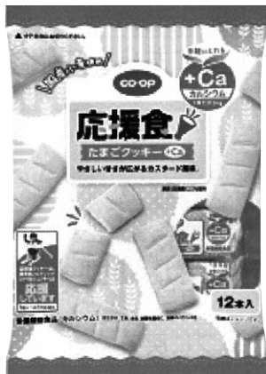
応援食 たまごクッキー+カルシウム