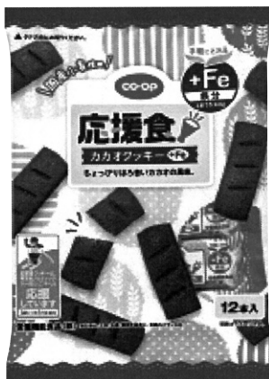
応援食 カカオクッキー+鉄分