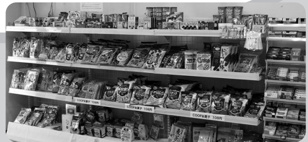
自治労会館売店(県内内線:5972)